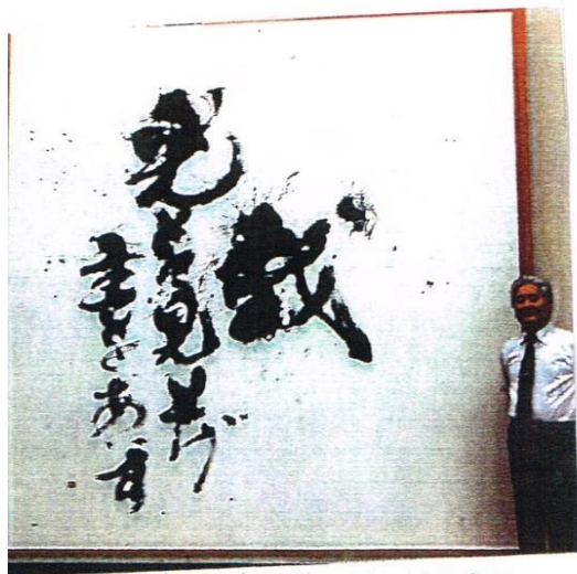
平成24年 第2回 昂光書展