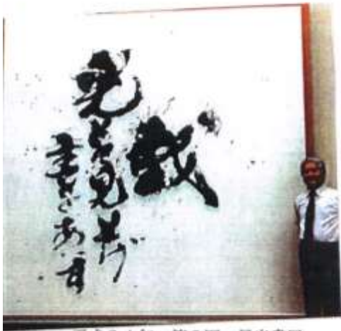
平成24年 第2回 昂光書展