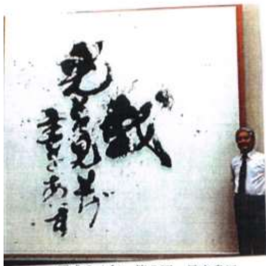
平成24年 第2回 昂光書展